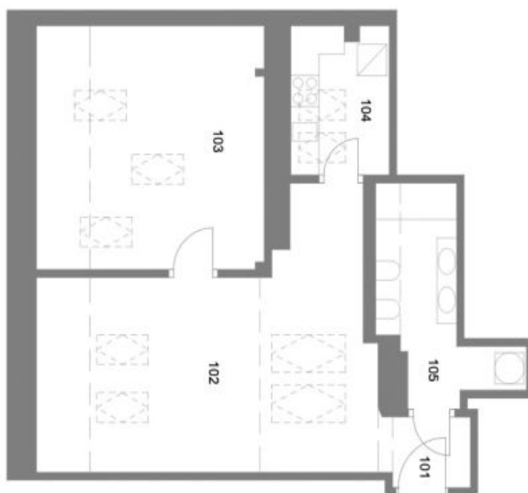
Podlahová plocha celého podkrovní