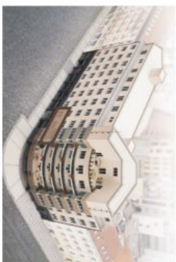
PODLAŽÍ / FLOOR

www.londonhouse.cz , info@londonhouse.cz