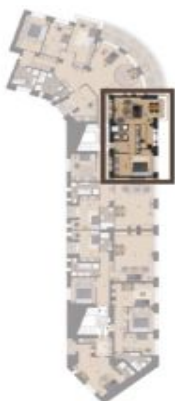
VÝMĚRA BYTU / FLAT AREA