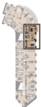
VMĚRA BYTU / FLAT AREA