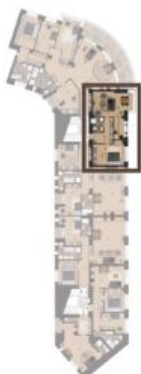
VÝMĚRA BYTU / FLAT AREA