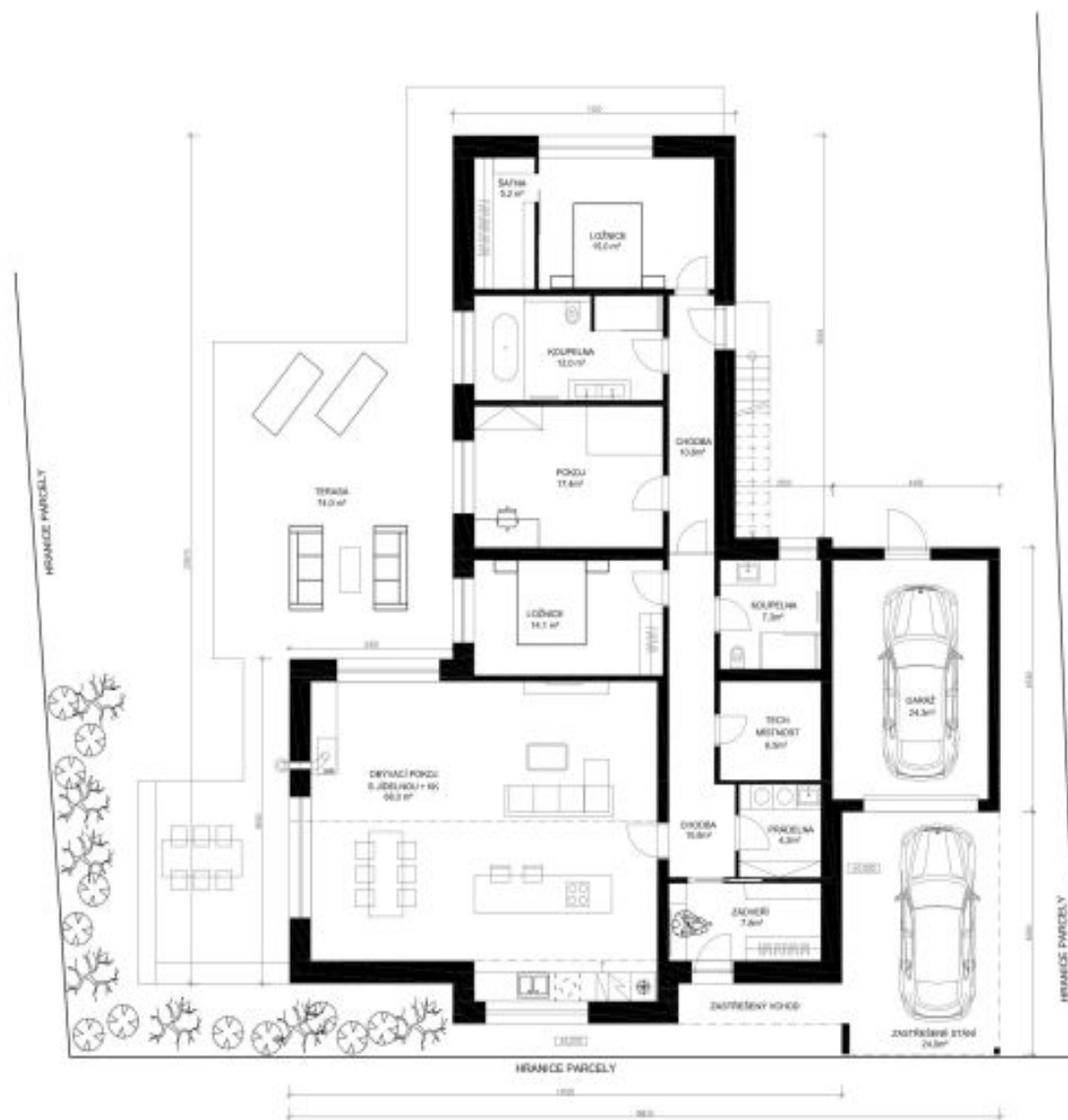
PŮDORYS 1NP - V KONTEXTU PARTERU