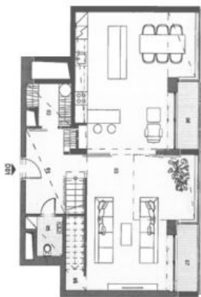
1. PATRO VSTUPNÍ PODLAŽÍ