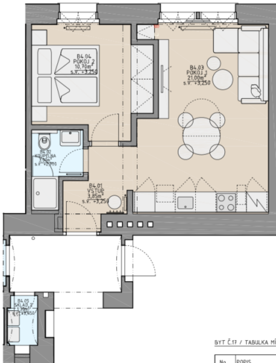
BYT Č.17 / TABULKA MÍSTNOSTÍ