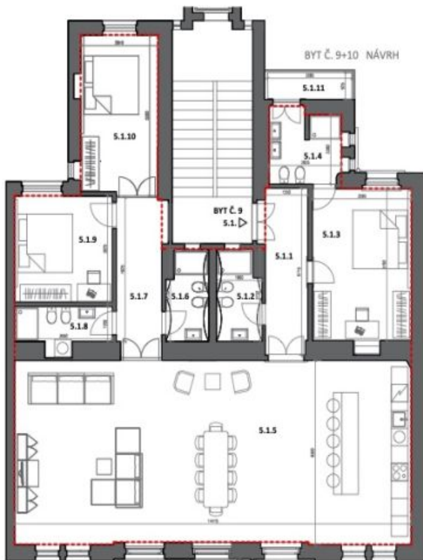
KŘIŽOVNICKÁ 6, STARÉ MĚSTO PRAHA 1 BYT Č. 9+10 NÁVRH