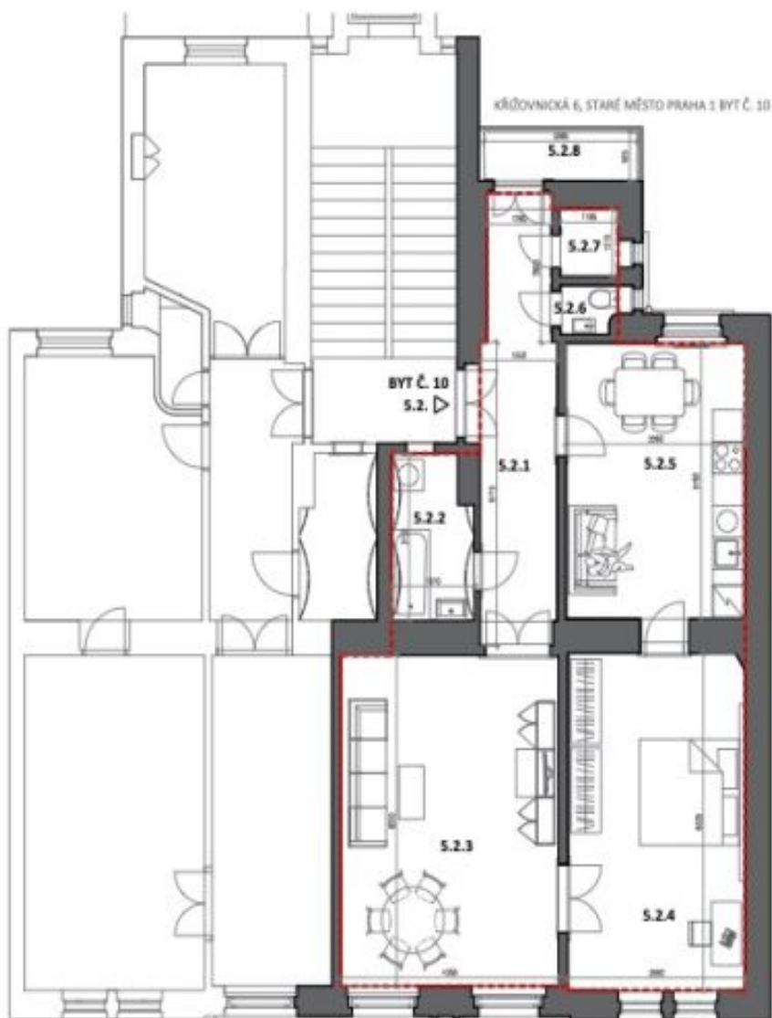
KŘIŽOVNICKÁ 6, STARÉ MĚSTO PRAHA 1 BYT Č. 10 STAVAJÍCÍ STAV