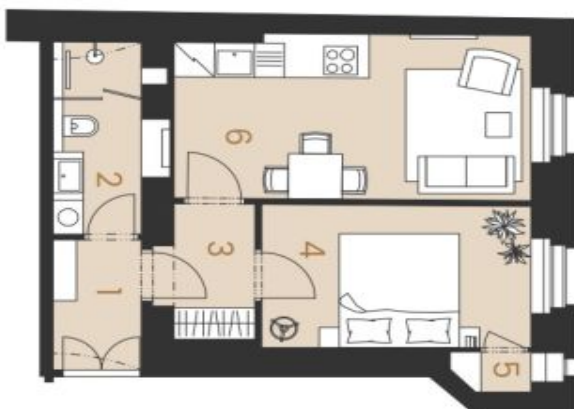
Schéma pôdoryhu bytu predstavuje dispozičnú štruktúru bytu. Kuchynská linka a nábytok nie sú súčasťou dodávky bytu, zařítení je zobrazeno pouze pro názornost. Speciálkova pro keramickou povrchové úpravy a materiál vyhovující je předním třídou "Standard nemovitosti".

svoboda&williams | CHRISTIE'S INTERNATIONAL REAL ESTATE