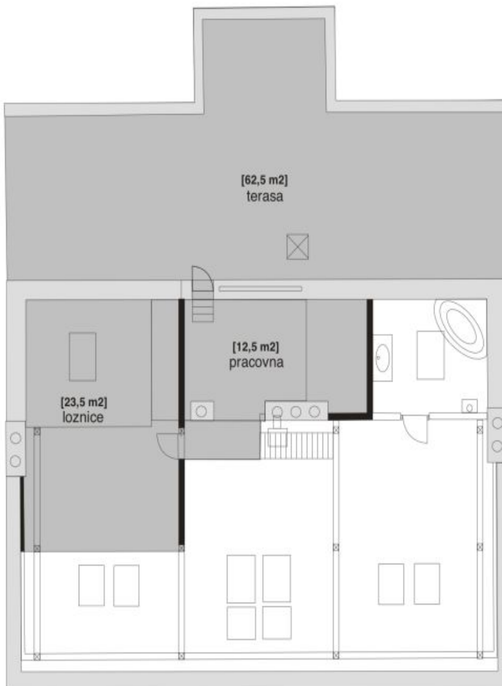
patro s terasou