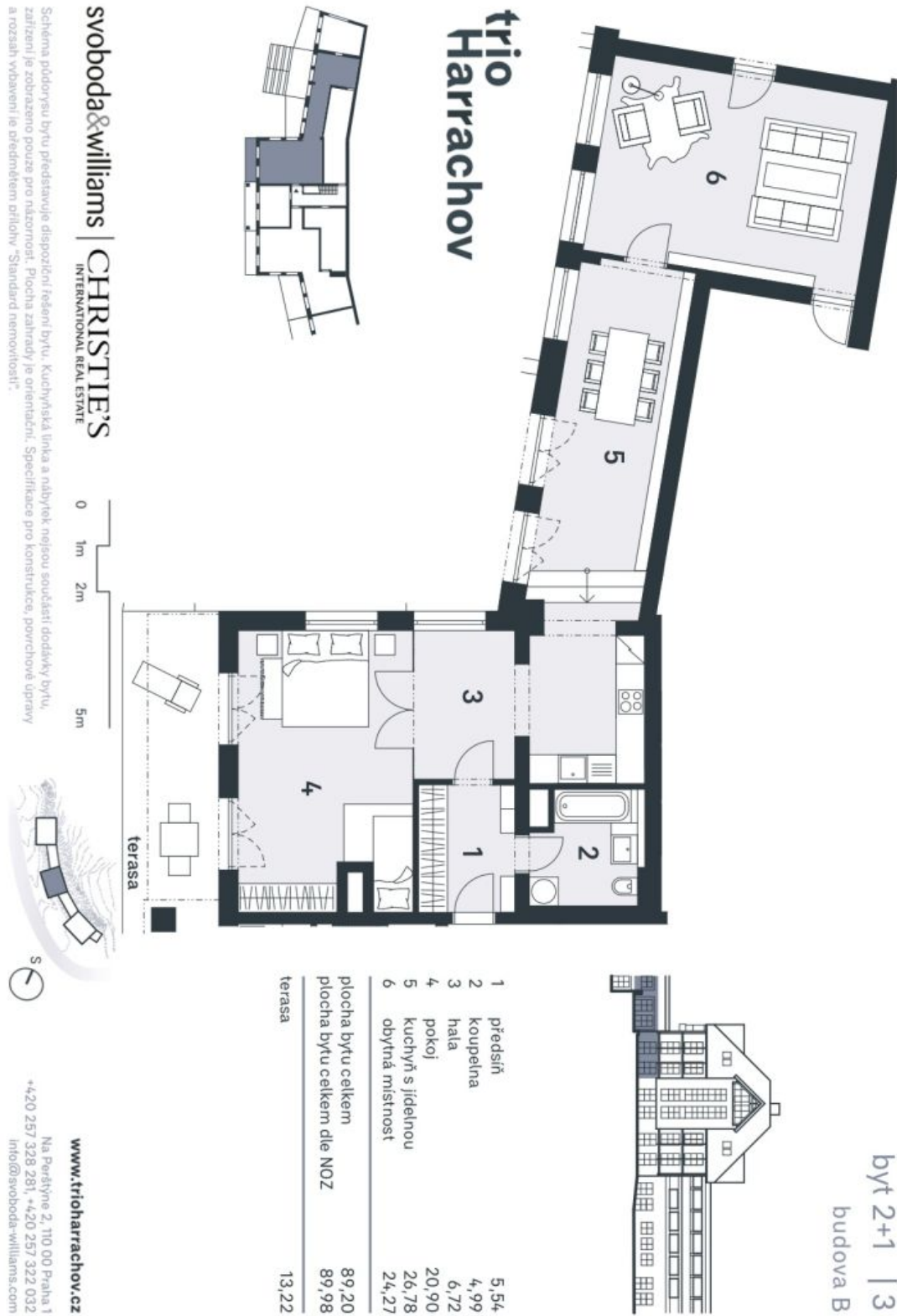
Schéma púřednyne bytu představuje dispozici řední bytu. Kuchyňská linka a nabyřek nejřou součástí dodáky bytu, zařzení je zobrazeno pouze pro názornost. Plocha zařřady je orientáční. Specifikace pro konstrukci, povrchové úpravy a rozsah vřbavení je ředním ředím příloh "Standard nemovitosti".