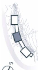
Schéma podlažního bytu představuje dispozici řádkové bytu. Kuchynská linka a nábytek nejsou součástí dodávky bytu, zařízení je zobrazeno pouze pro názornost. Plocha zahrady je orientační. Specifikace pro konstrukci, povrchové úpravy a rozsaň vybavení je předněm orloiv "Standard nemovitosti".