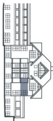
byt 1+kk | 6 budova A