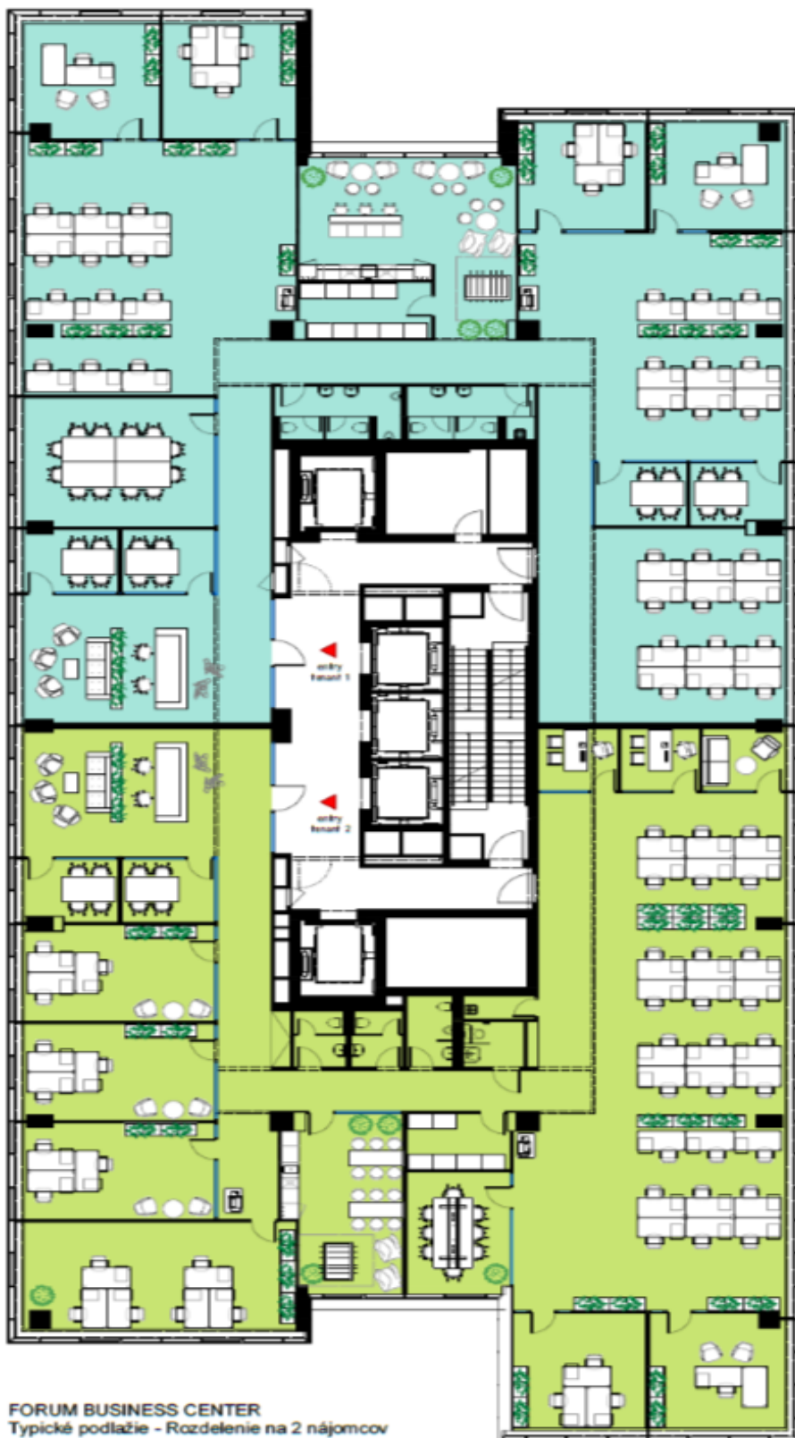
FORUM BUSINESS CENTER Typické podlažie - Rozdelenie na 2 nájomcov