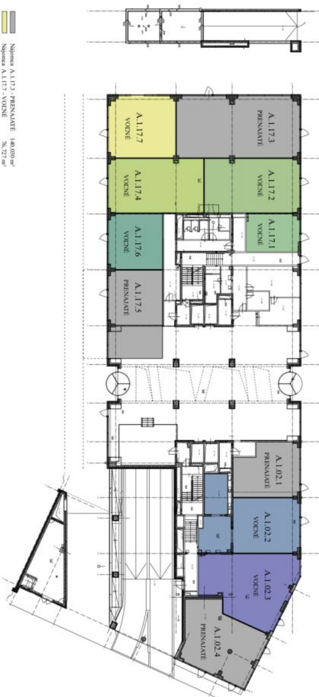
1 NP BOMA measurement standards