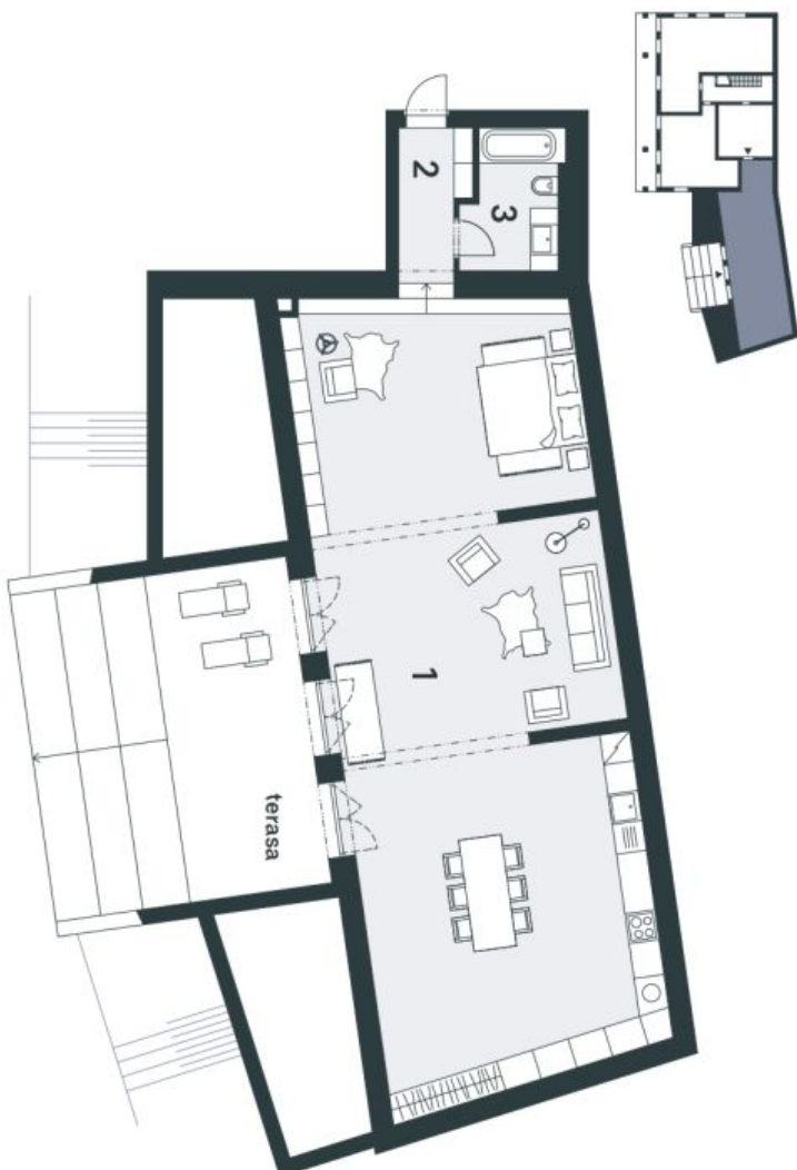
Schéma podkrovy bytu predstavuje dispozíciu riešeni bytu. Kuchynská linka a nábytok nejsou súčasťou dodávky bytu, zariadení je zobrazeno pouze pro názornost. Plocha zahrady je orientační. Specifikace pro konstrukce, povrchové úpravy a rozsah vybavení je předmětem přílohy "Standard nemovitosti".

svoboda&williams | CHRISTIE'S INTERNATIONAL REAL ESTATE