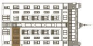
Schéma půdorysu bytu představuje dispozici řešení bytu. Kuchyňská linka a nábytek nejsou součástí dodávky bytu, zařízení je zobrazeno pouze pro názornost. Plocha zahrady je orientační. Specifikace pro konstrukce, povrchové úpravy a rozsah vybavení je předmětem přílohy "Standard nemovitosti".

svoboda&williams | CHRISTIE'S INTERNATIONAL REAL ESTATE