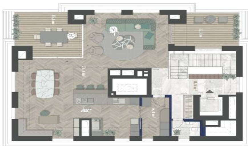
3. NP 3RD FLOOR