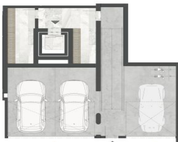
PODLAŽÍ GARÁŽI PARKING FLOOR