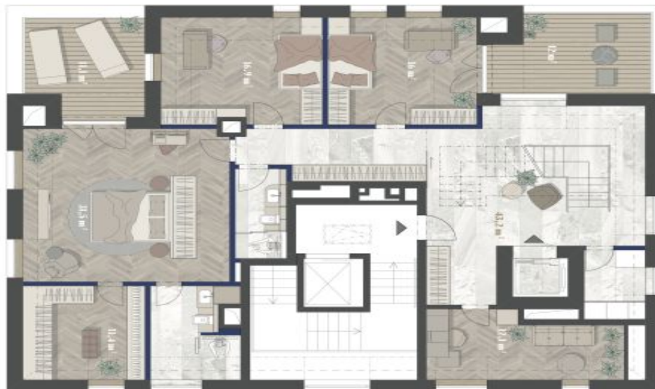
2. NP 2ND FLOOR