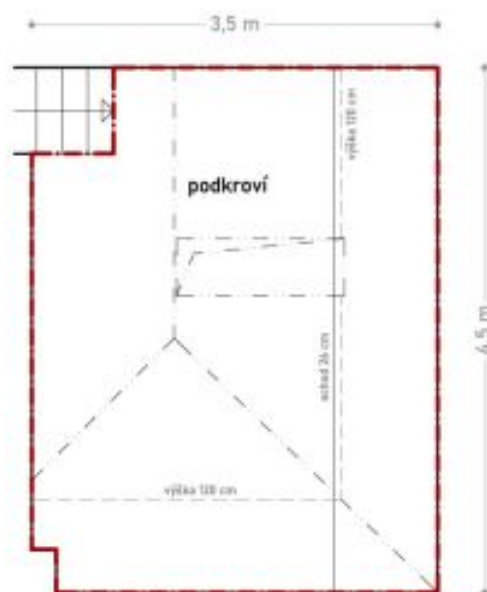
podlahová plocha podkroví 15,1 m 2