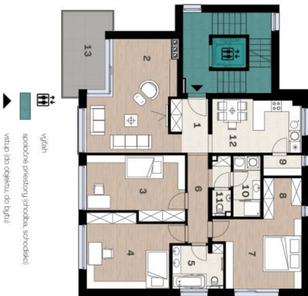
Schéma pôdorysu domu predstavuje dispozíciu nízkej rezidence bytu. Developer si vyhradzuje právo na zmenu a upresnenie bez predchádzajúceho upozornenia.