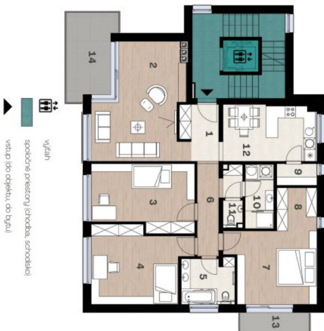
Schéma pôdorysu domu predstavuje dispozíciu niektorých bytů. Developer si vyhradzuje právo na zmenu a upresnenie bez predvýstrahy a upozornenia.