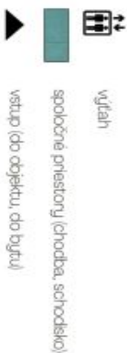
Schéma pôdorysu domu predstavuje dispozíciu resp. výstavbu bytu. Developer si vyhradzuje právo na zmenu a upresnenie bez predchádzajúceho upozornenia.