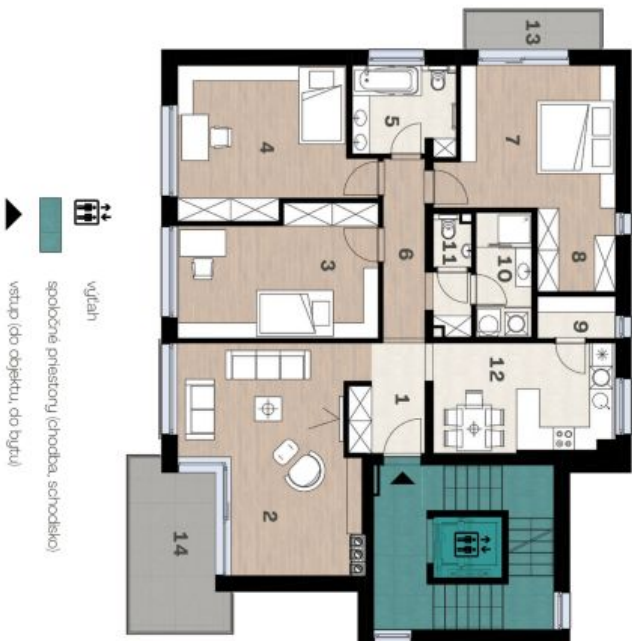
Schéma pôdorysu domu predstavuje dispozíciu niektorých priestorov bytu. Developer si vyhradzuje právo na zmeny a úpravy bez predvýstrahy a upozornenia.