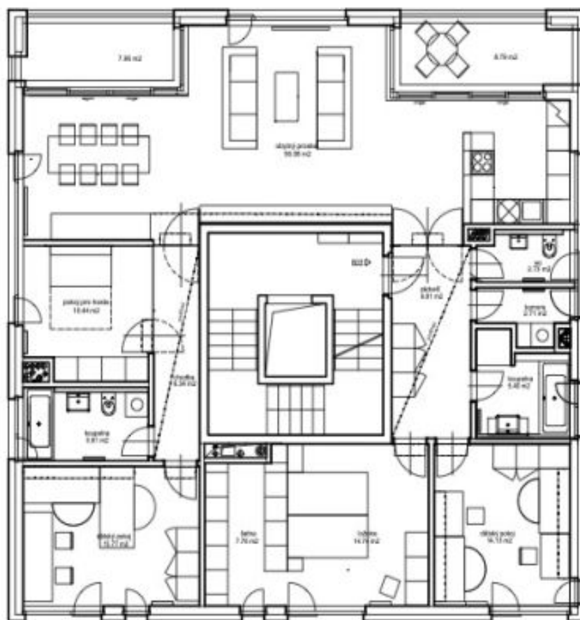
schéma bytu B21+B22 - 2np