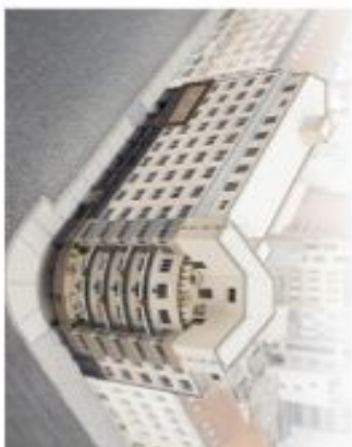
PODLAŽÍ / FLOOR