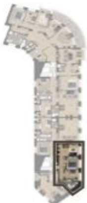
VÝMĚRA BYTU / FLAT AREA