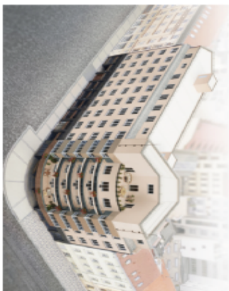
PODLAŽÍ / FLOOR