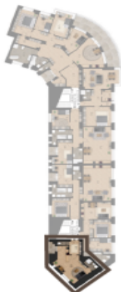
VÝMĚRA BYTU / FLAT AREA