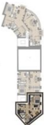
PÓDLAŽÍ / FLOOR